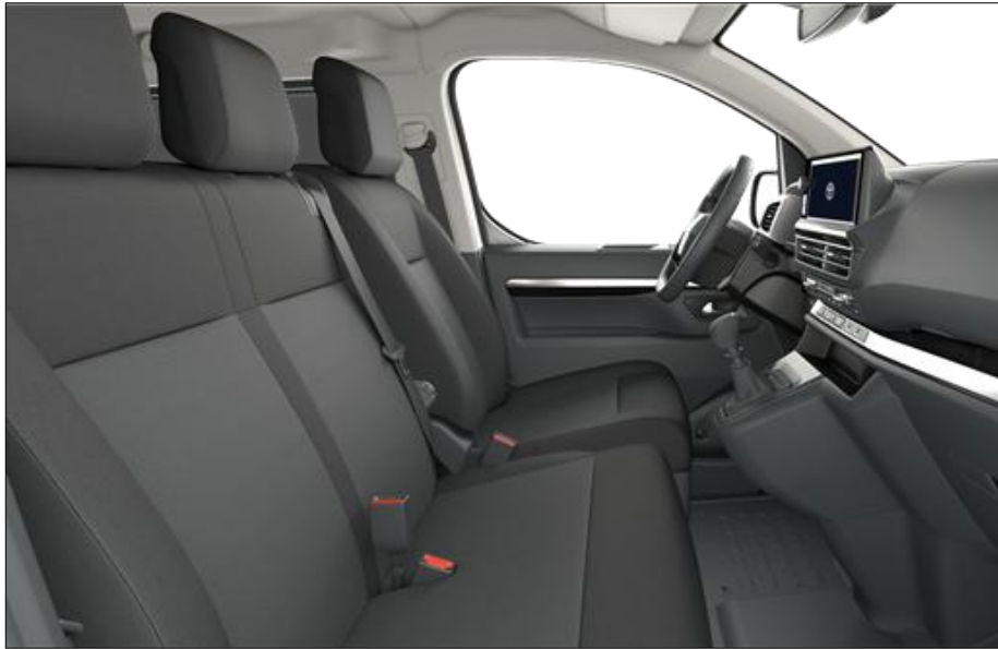
Tapiterie din stofa de culoare gri inchis (FT+CM)