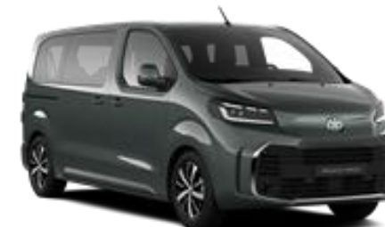
All Terrain Green* (EDU)