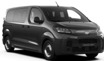
Titanium Grey* (KKJ)