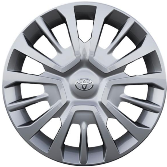
Jante otel 17" cu capace (5 spite triple)