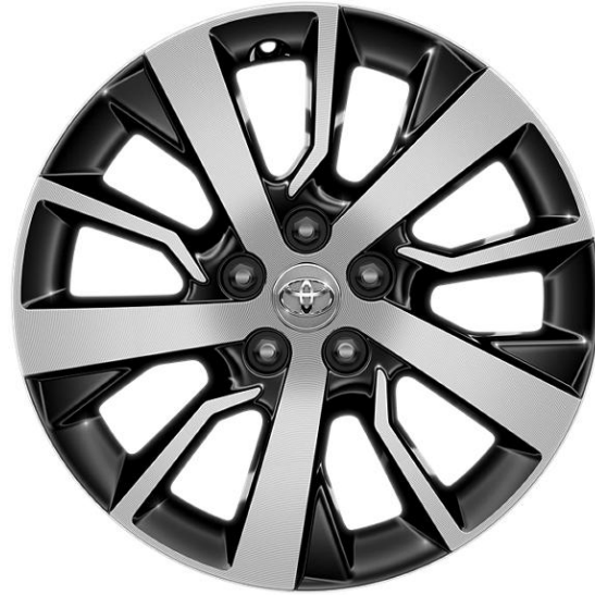
Jante aliaj 17" cu aspect forjat (5 spite duble)