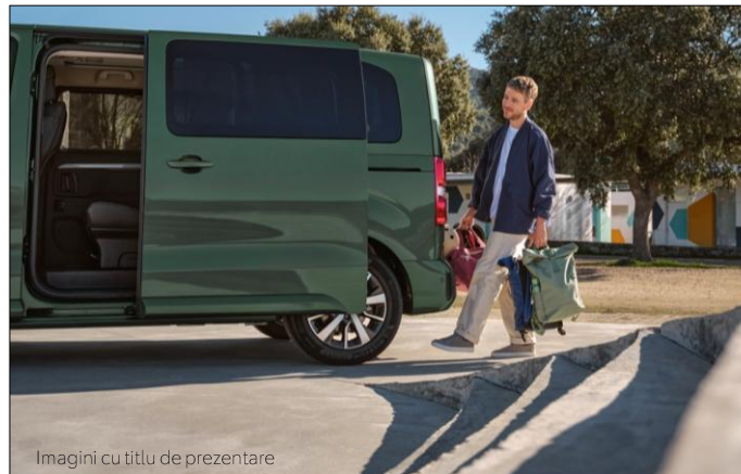
Imagini cu titlu de prezentare