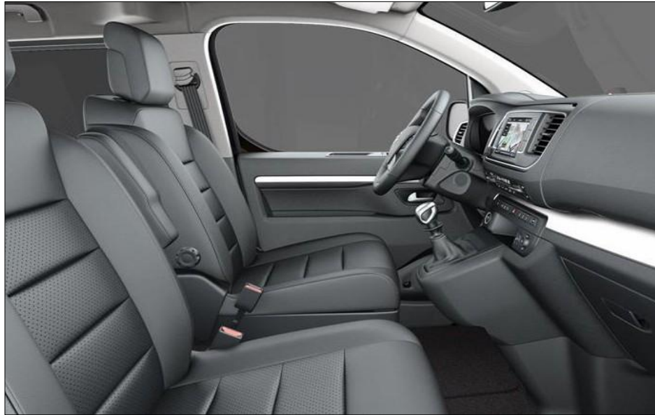
Tapiterie din piele mixta (naturala + sintetica) de culoare neagra (FX+CY)