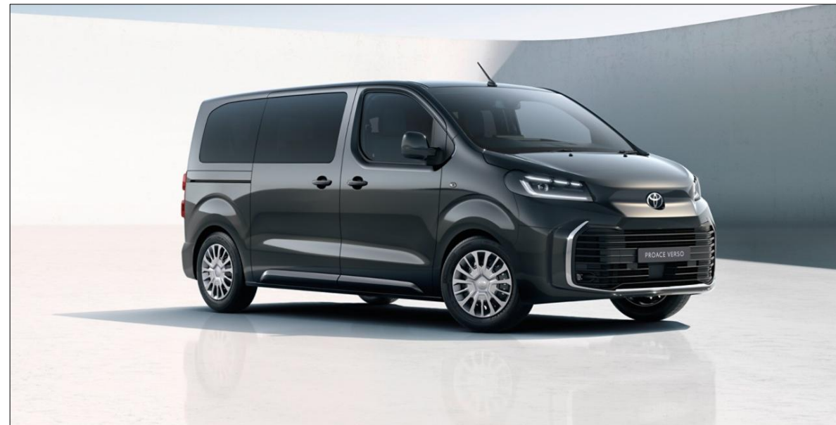
Imagini cu titlu de prezentare