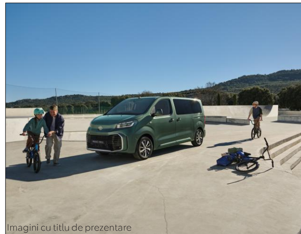
Imagini cu titlu de prezentare