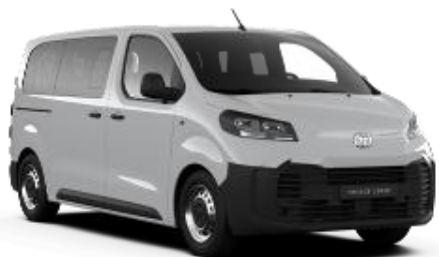
Icy White (EPR)