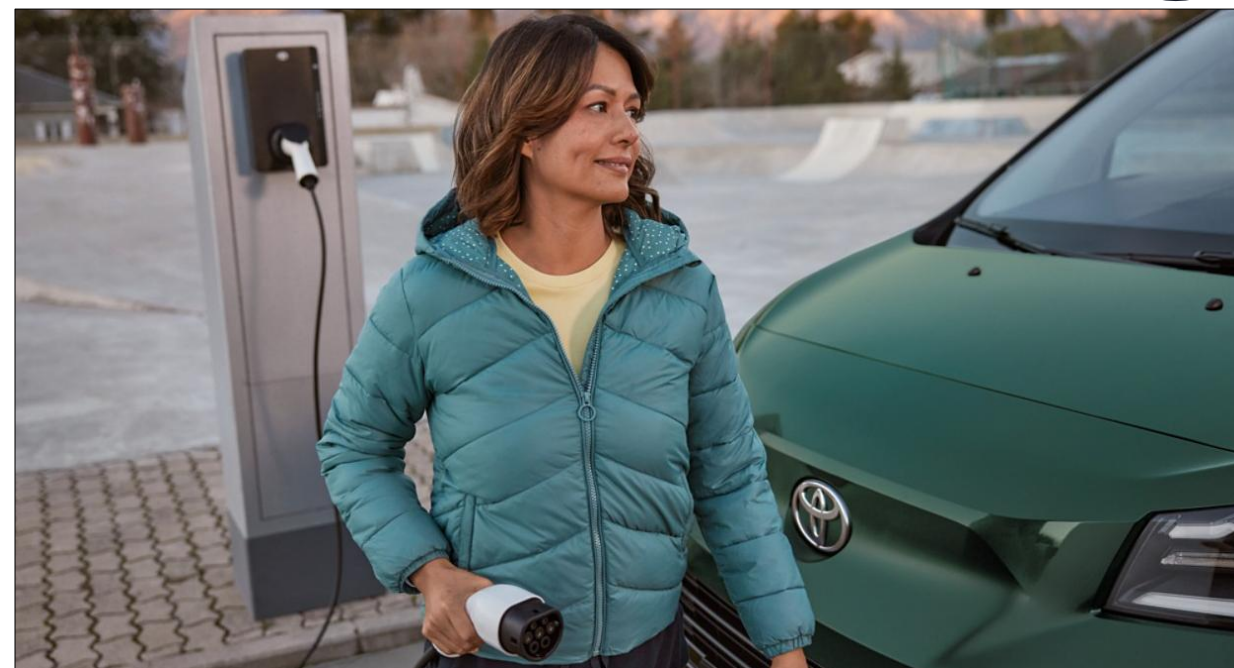
Cablu de incarcare Wallbox Type 2 Mode 3/ 32A