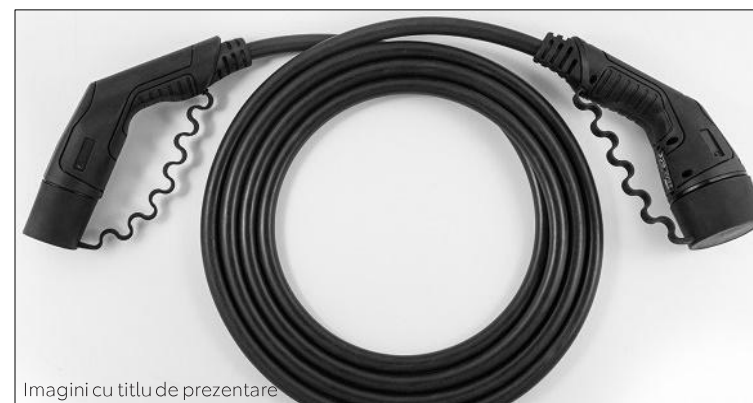
Imagini cu titlu de prezentare