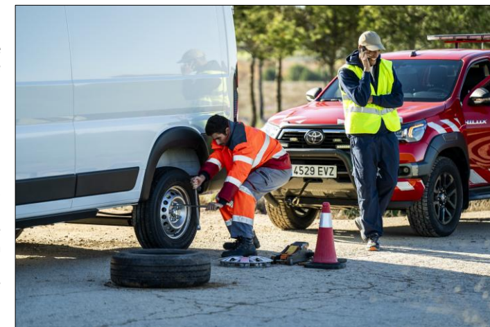
Imagini cu titlu de prezentare